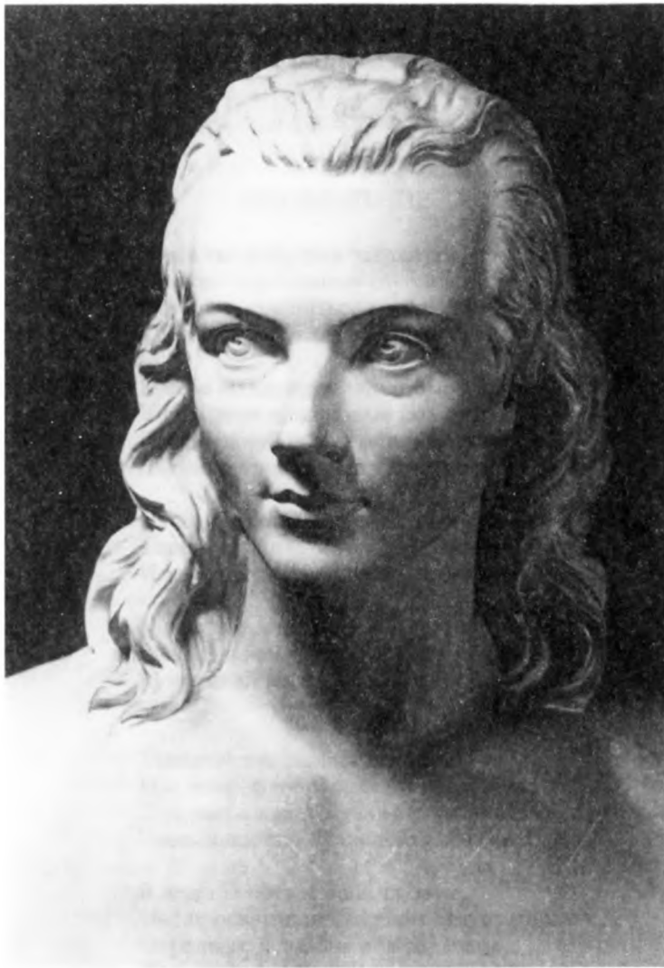
Бюст Новалиса на его могиле. Город Вейсенфельс. Скульптор Фридрих Шапер.